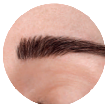
Maquillage permanent sourcils