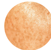
Tâches de rousseur