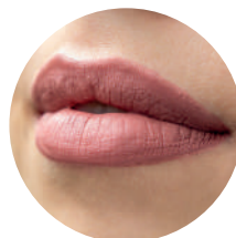
Maquillage permanent lèvres